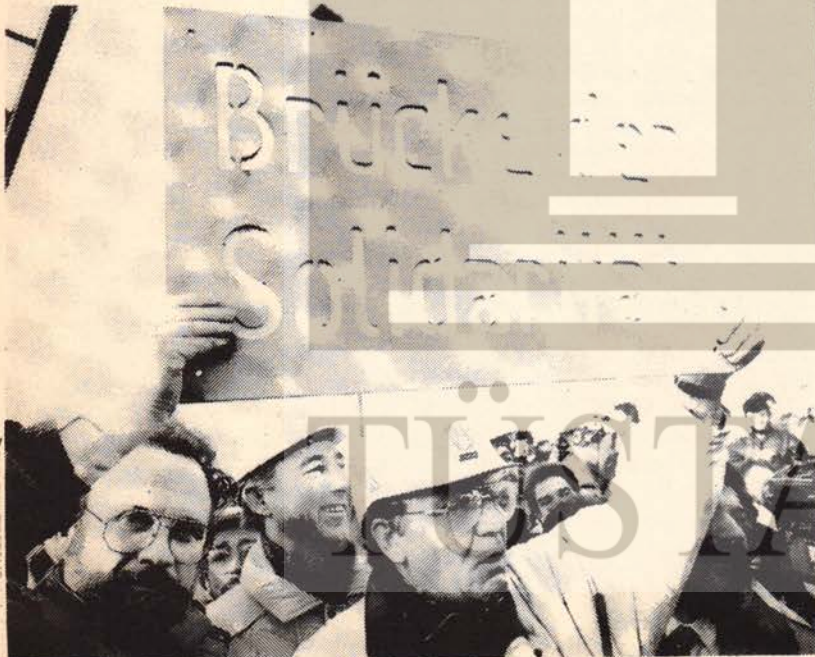
Krupp, Thyssen ve Mannesmann çelik işçileri bombalanmış Rhein köprüsünü savaşın ertesinde yeniden birlikte inşa etmişlerdi. Şimdi yeni ismini de birlikte koydular: Dayanışma Köprüsü.

Rheinhausen direnişi başka şeyler de öğretti: Alman, Yugoslav, Yunan, İtalyan, Türk ve Kürt işçileri tüm eylemlerde yıkılmaz bir bütünlük içindeydiler. Daha güzel bir dünya kurmak için mücadele eden işçiler ancak yerli, yabancı ayrımı yapmaksızın ortak davaları için birlikte mücadele ederlerse başarıya ulaşabilirler. Rheinhausen işçileri bu birliğin güzel bir örneğini veriyorlar. ■